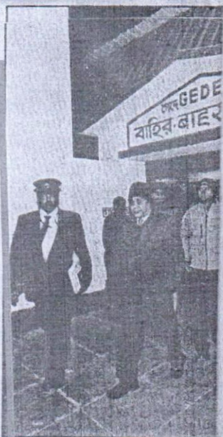
গোদে স্টেশন পরিদর্শন করছেন।